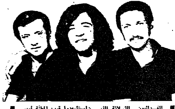
الضباط الثلاثة الذين استشهدوا قرب الخطة امس